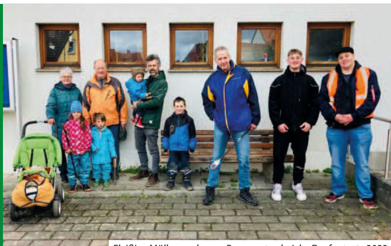
Fleißige Müllsammler aus Bremgarten bei der Dorfputzete 2023