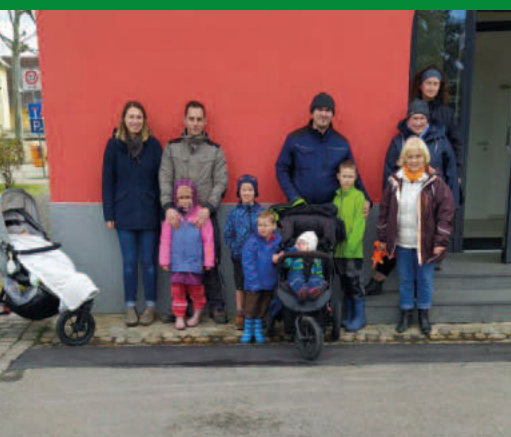
Auch in Feldkirch wurde generationsübergreifend das Dorf sauber gemacht.