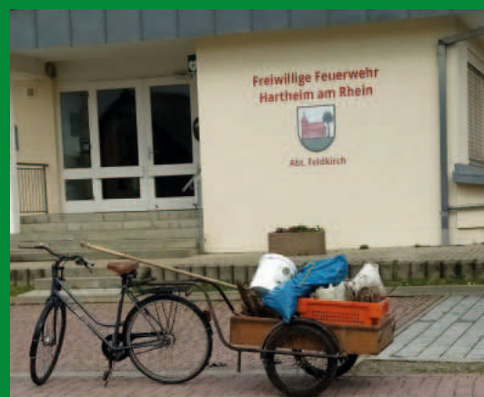
Moderne Müllsammlung mit dem Drahtesel in Feldkirch