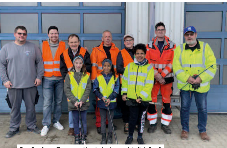
Das Dorfputz-Team aus Hartheim hatte sichtlich Spaß