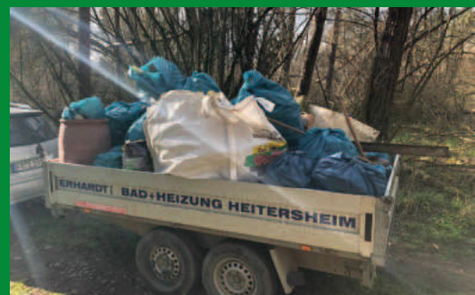
Eine große Menge an Müll beim ASV Bremgarten