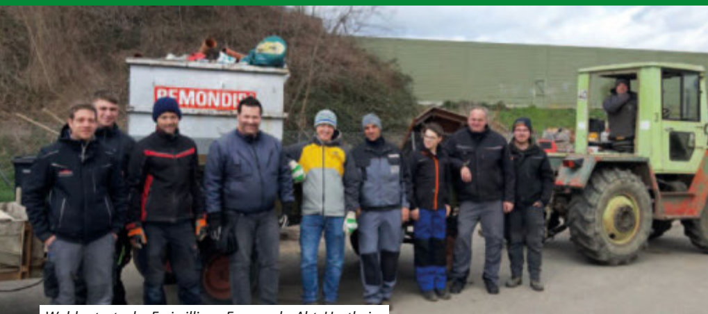
Waldputzete der Freiwilligen Feuerwehr Abt. Hartheim