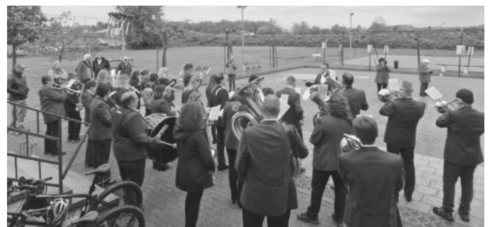
Der Musikverein Feldkirch beim Maibaumstellen der DJK Feldkirch am Sportplatz

Bilder von diesem Tag können Sie in der Fotogalerie auf der Webseite des Musikverein Feldkirch betrachten: