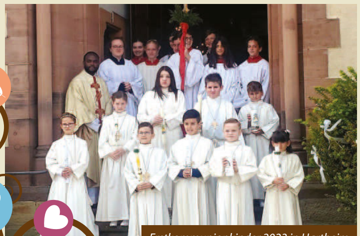
Erstkommunionkinder 2023 in Hartheim