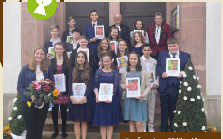
Konfirmation 2023 in Mengen