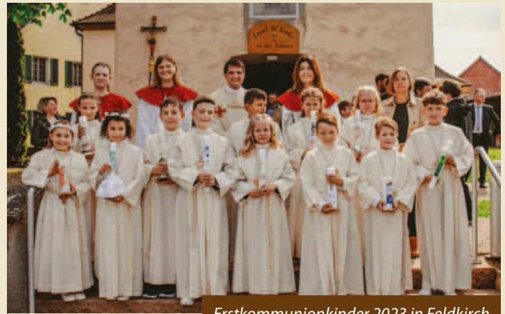
Erstkommunionkinder 2023 in Feldkirch